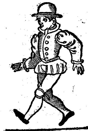
De Capriol , een danspas in de galliarde . Uit: Orchesographie , 1589.

Bronnen: The Oxford Companion to Music , september 2016; Grove Music Online , september 2016.