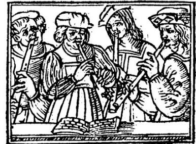
Voorpagina van S'ensuyvent plusieurs Basses dances tant Communes que Incommunes , dansboek gepubliceerd door Jacques Moderne in 1532 of 1533.