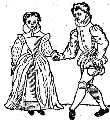
De Reverence , een danspas in de basse danse.

De basse danse (Italiaans: bassadanza ) is de belangrijkste hofdans gedurende de late Middeleeuwen en het begin van de 16e eeuw. De naam wijst op de laag bij de grond uitgevoerde danspassen, die een contrast vormen met de snellere springdansen. De dans werd uitgevoerd door paren met plechtige en deftige schuivende bewegingen. De nadans (bijvoorbeeld de to(u)rdion of recoupe ) werd uitgevoerd met levendiger bewegingen en sprongen. De vroegst bekende muziek voor de basse danse dateert uit de 15e eeuw. Het melodische materiaal is gecentreerd rond een soort cantus firmus of tenor, waaromheen de andere partijen improviseerden. Elke noot van de tenor correspondeerde met één danspas en de melodie was vaak ontleend aan een bestaande bron. De maatsoort is meestal tweedelig, soms driedelig of een samenstelling van beide. Halverwege de 16e eeuw zijn nog basse danses voor meerstemmige ensembles gedrukt en uitgegeven, door bijvoorbeeld Jacques Moderne (ca. 1495-1500 – na 1562), Pierre Attaingnant (ca. 1494 – 1551/1552) en Tielman Susato (ca. 1510-1515 - 1570 of later) en gebaseerd op chansons van componisten als Claudin de Sermisy (ca. 1490 – 1562) en Pierre Sandrin (fl. 1538 - ca. 1561).